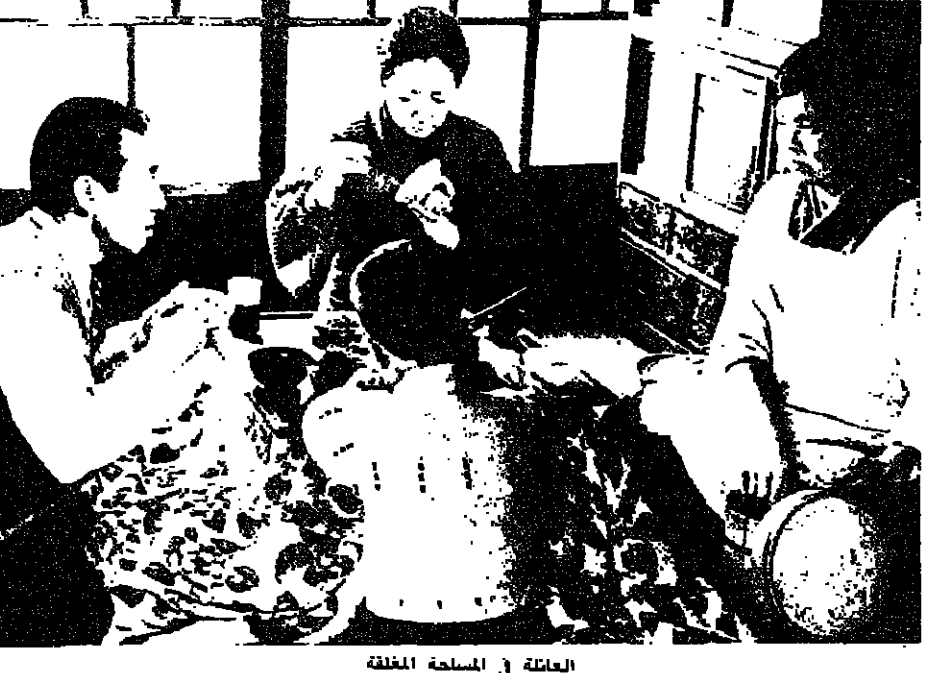
العائلة في الساحة المغلقة